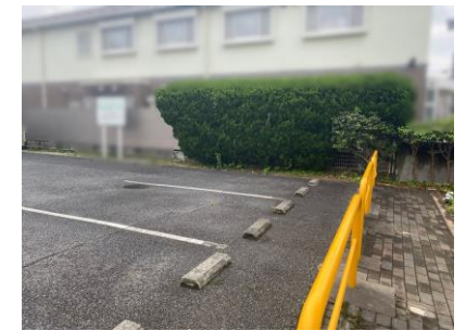
建物正面側 駐車場・テラス