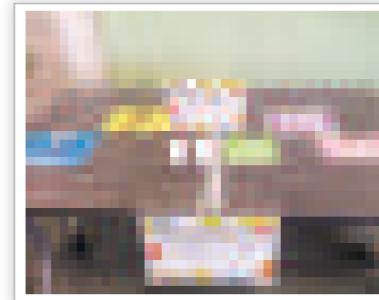
▲色やはんこを組み合わせるとオリジナル葉に!

当日はセンターのイベント「とねりマルシェ」と同時開催かつ、自由参加ということもあり、大人から子どもまで幅広い年代の方にご参加いただきました。