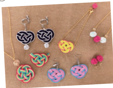
⑦ ミズヒキアクセサリィ 結

日本でも歴史が古い《マクラメ編み》という紐を結ぶ技法を使ってスマホショルダーや小物を中心に作品をご用意します。楽しみにいらしてください！