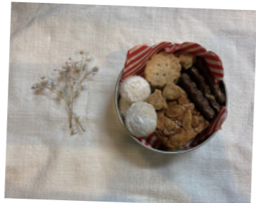
⑧ チトホームスイーツ chito home sweets

水引には人と人とを結びつける意味が込められています。そんな水引を身につけてみませんか。