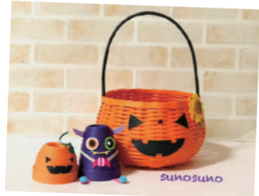
⑤ クラフトバンド すのすの