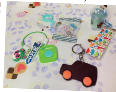
⑪ あもか あびにやー amoka abinya

手にとった時、身につけた時に自然と笑顔になれる様な作品作りをしています。生地や色、パーツの合わせ方を楽しんでいただくとありがたいです。