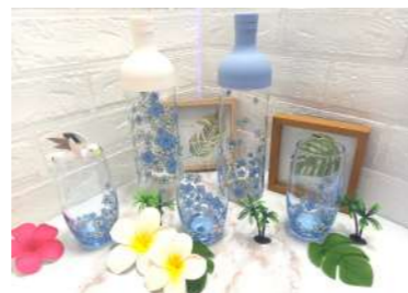
③ フレーズ Fraise

飾るところを選ばない花雑貨。お好きな空間に飾っていただき、ホッと一息お花を眺め、癒しをお届けできる作品を心がけて制作しています。