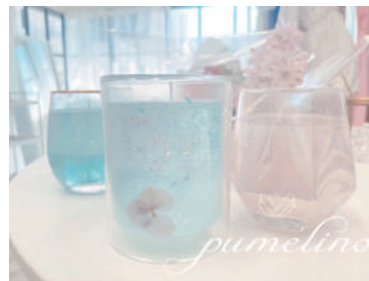
① プメリノ pumelino