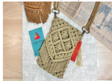
⑥ いれかしょっぷ ireka_shop

クラフトバンドで作ったかわいい雑貨の販売と、小さなお子さまでもできるワークショップ♪